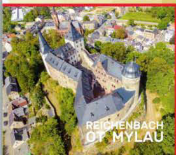
REICHENBACH OT MYLAU

📍 GÖLTZSCHTALBRÜCKE - BURGRUINE ELSTERBERG ca. 10,5 km