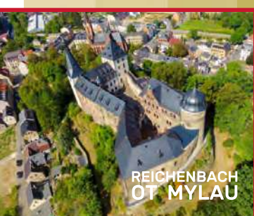
REICHENBACH OT MYLAU

📍 GÖLTZSCHTALBRÜCKE - WALDBAD ELSTERBERG ca. 11,0 km